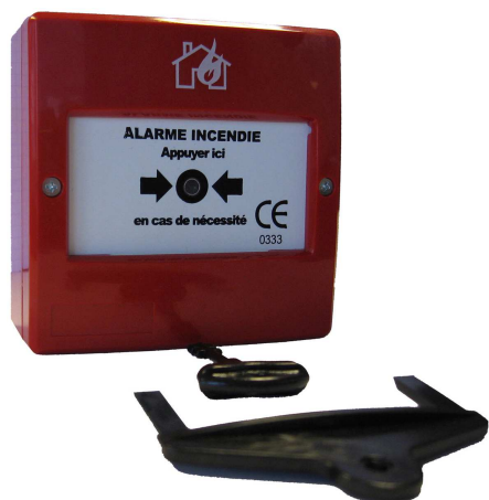
déclencheur DMCL05 et accessoires