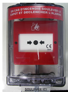
KEDM avec DM