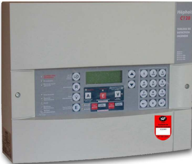
Variante Héphaïs C128

D'une capacité maximale de gestion de 128 points répartis sur 99 adresses de zone, ses qualités d'interactivité et de convivialité sont très appréciées des utilisateurs et des personnels de maintenance. Héphaïs 128 est associé aux détecteurs adressables ponctuels, multiponctuels ou/et linéaires des gammes A05 et A95, ils autorisent grâce à une analyse fine des valeurs de réponse, une signalisation précoce de l'incendie.