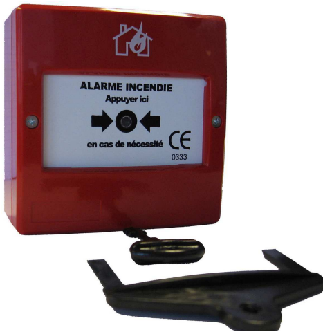
déclencheur DMA05 et accessoires