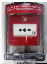
KEDM avec DM