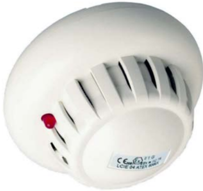
détecteur VOEX et socle S95EX