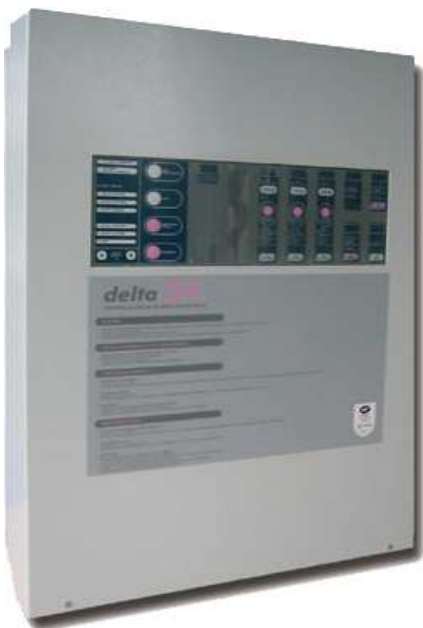
Delta 24/8.VM équipé d'un D2AG et d'un D4U

En catégorie A, ils sont utilisables en association avec tout système de détection incendie, et offrent en particulier une parfaite compatibilité avec les équipements de contrôle et de signalisation conventionnels ou adressables Alpha ou Héphaïs, de même fabrication.